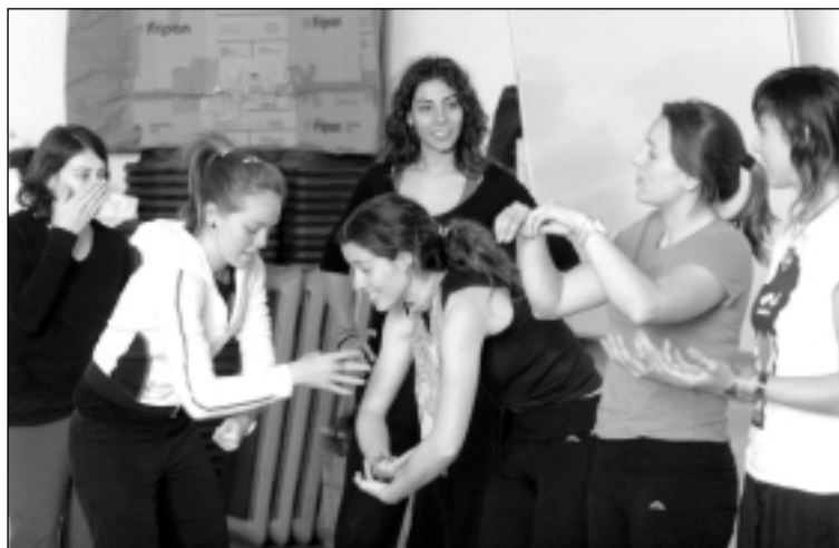
Varios de los asistentes al curso, durante uno de los ejercicios.