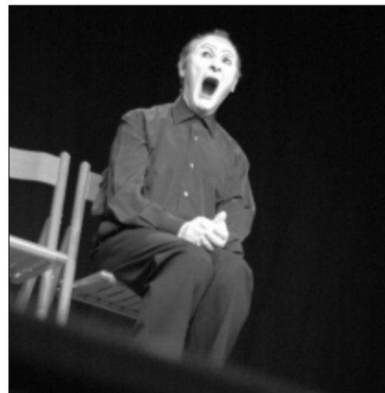
El público disfrutó con su actuación. A.D. ORTIZ

futuro". Lo más sorprendente, comentó, "es que muchos compañeros actores siguen buscando trabajo". Para sus actuaciones no requiere dominar un idioma porque "en todos los países se ríen al mismo tiempo". Aunque en esta globalización, puntualizó, "la asignatura pendiente es conseguir que sigamos riendo al mismo tiempo".