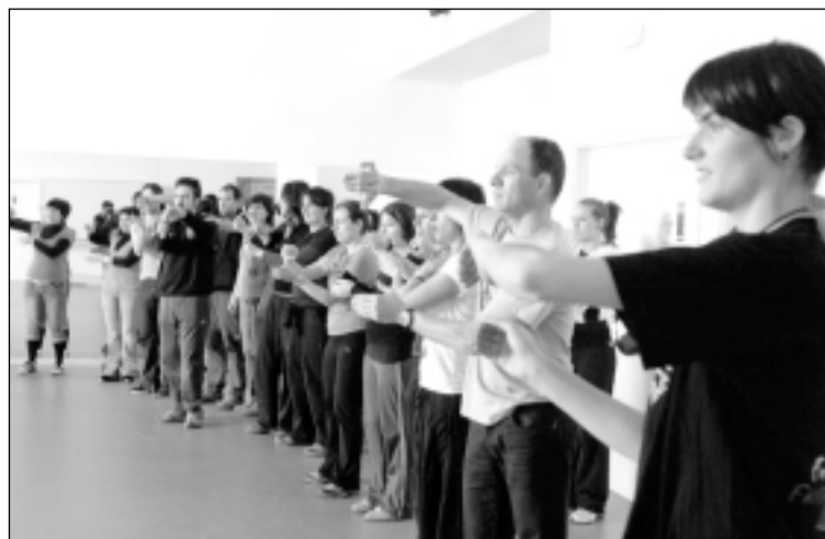
Los alumnos siguieron muy atentos las orientaciones. P. SEGURA